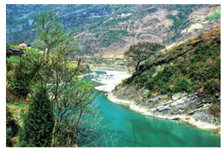
藻渡河沿线风光