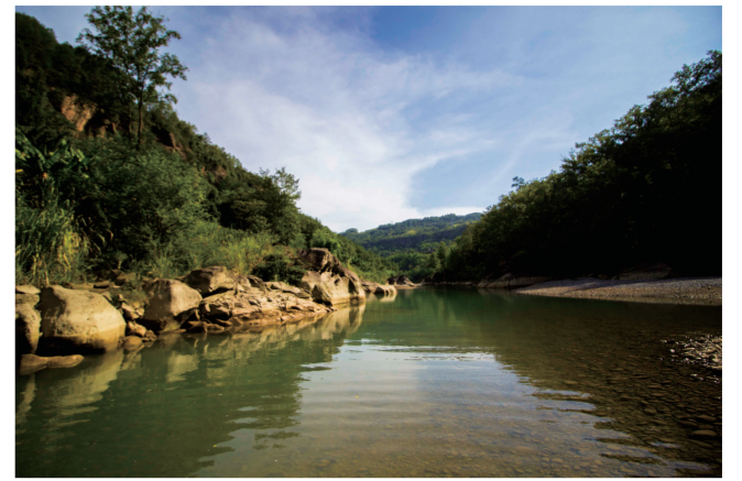
藻渡河水水质优良

通告明确,自该通告发布之日起,实物调查范围内禁止新增建设项目和迁入人口,禁止农村土地流转,禁止抢栽、抢种花卉苗木,禁止抢搭、抢建建(构)筑物和改变房屋用途。违反该通告的新增建设项目、花卉苗木和迁入人口一律不享受现有搬迁安置政策。