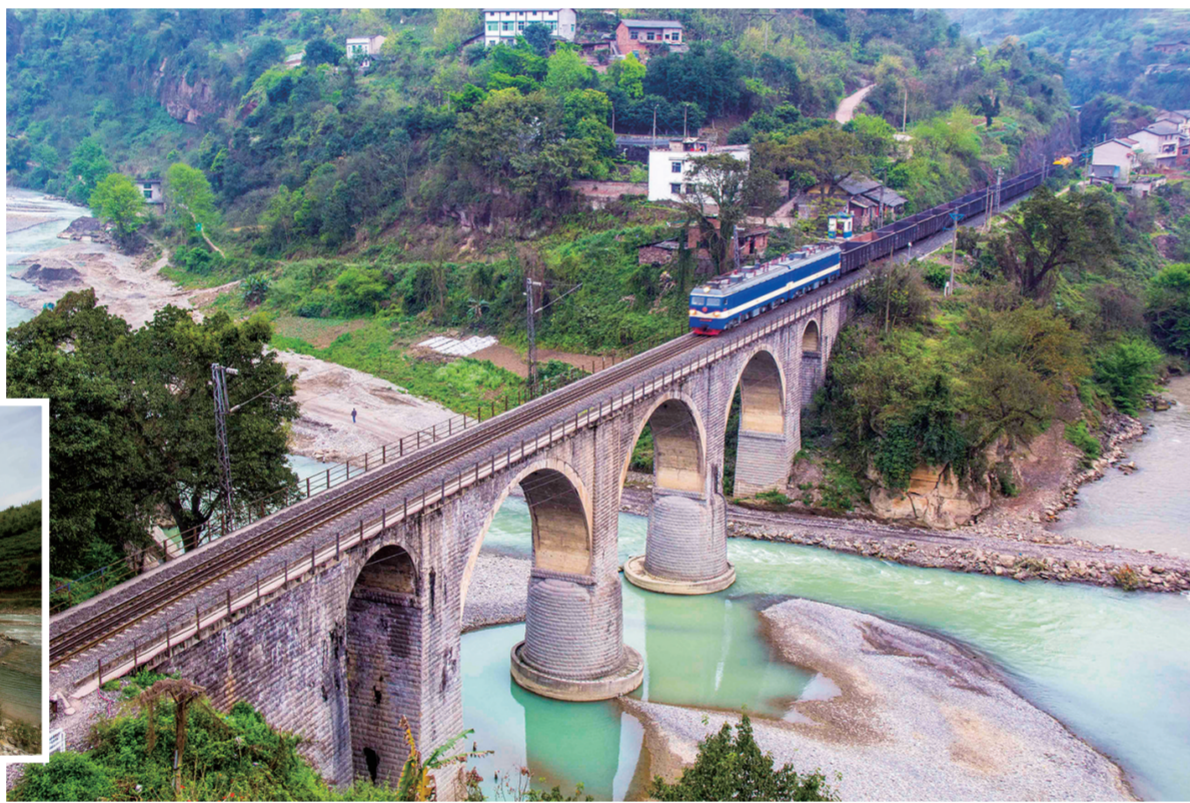
藻渡河在赶水汇入綦河