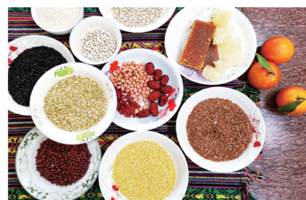
熬腊八粥的各种食材