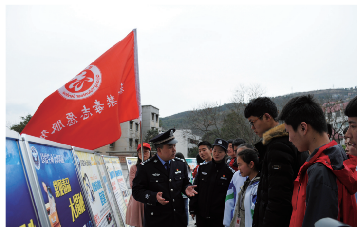
禁毒教育走进綦江中学

品的免疫力。受国际国内各种复杂因素影响，禁毒斗争面临的形势依然严峻复杂，禁毒工作任重而道远。实践证明，根除毒品流弊，必须形成“全民禁毒”的氛围。只有广泛发动人民群众，全民抵抗、全员出击，方能守护一方净土。