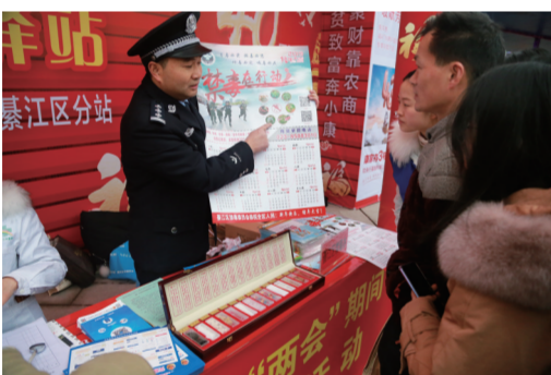
民警向群众宣传禁毒知识

禁毒工作事关国家安危、民族兴衰、人民福祉，毒品一日不除，禁毒斗争就一日不能松懈。近年来，我区公安局依法严厉打击毒品违法犯罪，加大重点区域、场所整治力度，坚决摧毁制贩毒团伙网络，深挖涉毒黑恶势力及其“保护伞”，并以严打严管严控为抓手，坚持关口前移、预防为主，同时推进“六进”活动，大力宣传禁毒知识，广泛发动群众，以人民群众为最坚实、最可靠的后盾，在全区形成自觉抵制毒品的浓厚氛围。