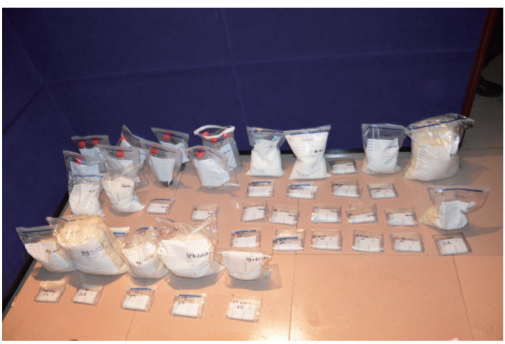
公安禁毒人员查获的毒品