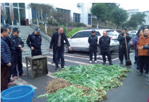
集中铲除销毁毒品原植物