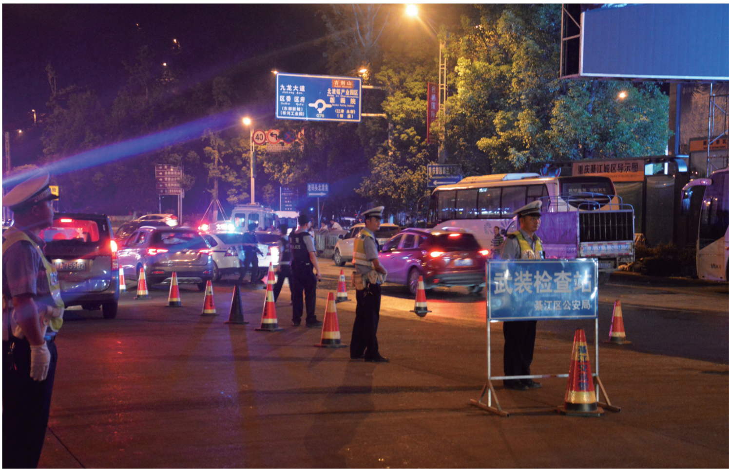
区公安局禁毒支队开展专项行动

据区公安局禁毒支队民警介绍，在全线出击、全警参与、全民动员下，2018年至今，全区破获毒品案件107起，抓获毒品犯罪嫌疑人124人，缴获各类毒品8.69千克。全区累计查获吸毒人员708人次，强制隔离戒毒255人，戒断三年未复吸在库人员2134人，同比增长18%，毒品“刚需”不断减少，市场萎缩。