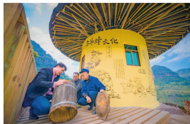
中峰镇中峰村蜜蜂园