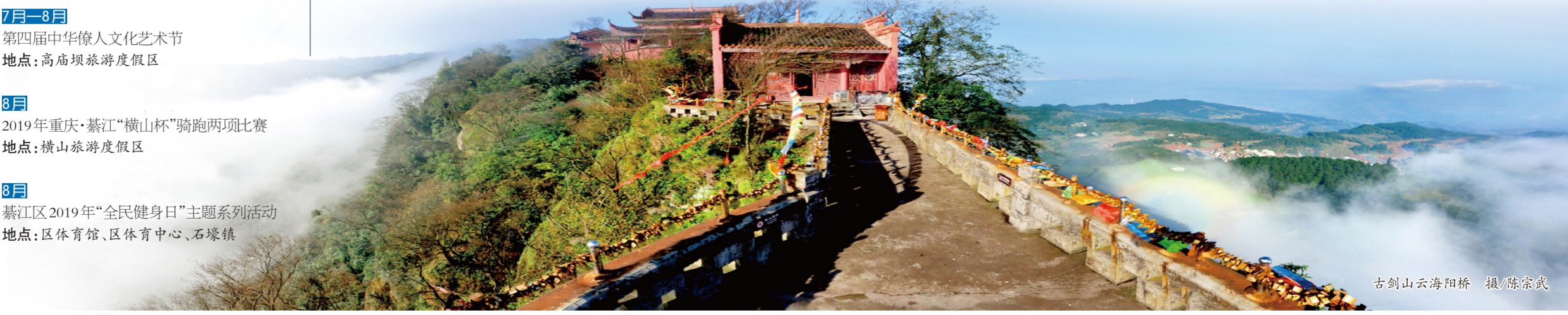
古剑山云海天桥