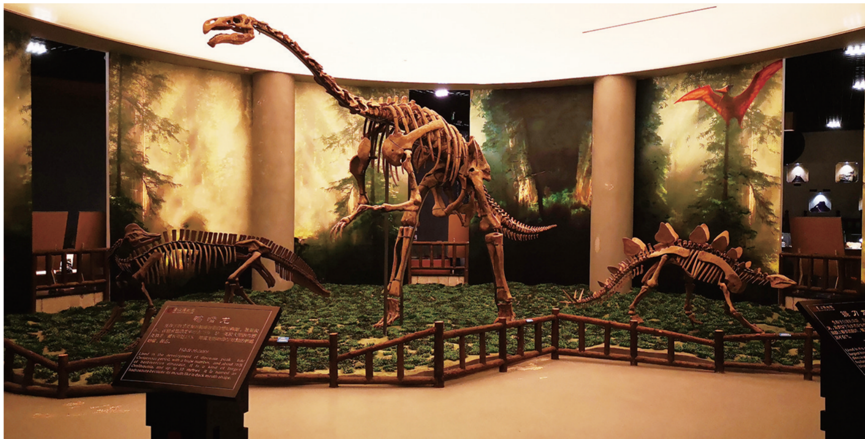
綦江博物馆地质文化厅

漫步在地质文化厅,就如穿越时空隧道,观众沿着恐龙的足迹,探寻神秘的远古时代,了解生命的演化历程。参观了地质文化厅,再分别到翠屏山木化石群、老瀛山恐龙足迹景区、古剑山景区去实地探秘,你一定会惊叹大自然的伟大,生命的顽强。