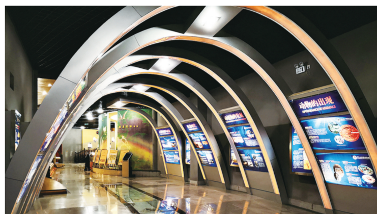
走进綦江国家地质公园博物馆 如穿越时空隧道