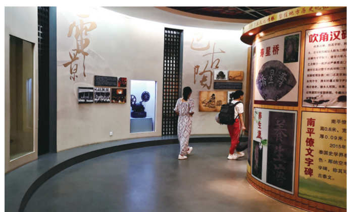
游客在綦江博物馆历史文化厅参观

《影像綦江》通过大型电子虚拟书借助影像设备,充分展示綦江的历史文化;《国际綦江》包括第二次世界大战中的綦江历史事件和韩国临时政府在綦江的工作。这些人和事都是綦江历史上的靓丽风景,这道风景让綦江在国际上享有盛誉。