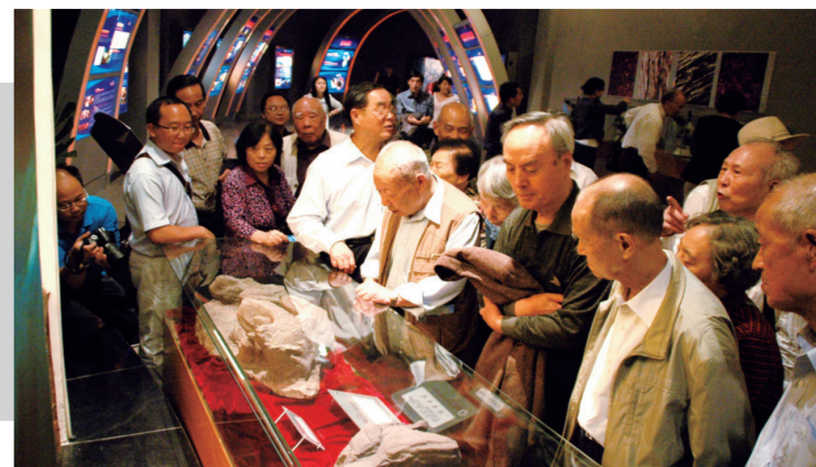
市民参观綦江博物馆

綦江博物馆位于古南街道农场社区。綦江博物馆的前身是綦江石刻艺术博物馆,1997年从綦江三角镇石门寺搬迁而来。2008年,在此基础上扩建,形成了一座综合性的博物馆。博物馆设有地质文化、历史文化和石刻艺术等展厅,面积达2100多平方米,馆藏文物8129件。2011年5月18日,綦江博物馆正式对外开放。 目前,綦江博物馆是国家AAA级景区、同济大学历史建筑保护中心西南实验基地、重庆市科普教育基地、重庆市人文社科普及基地和中国魏晋南北朝史学会僚学研究中心。