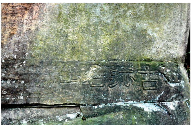
“古迹名山”字样清晰可见