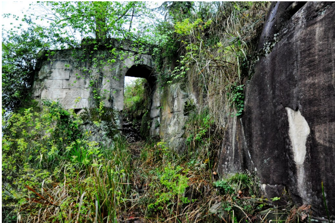
固如金汤的寨门,至今保存完好