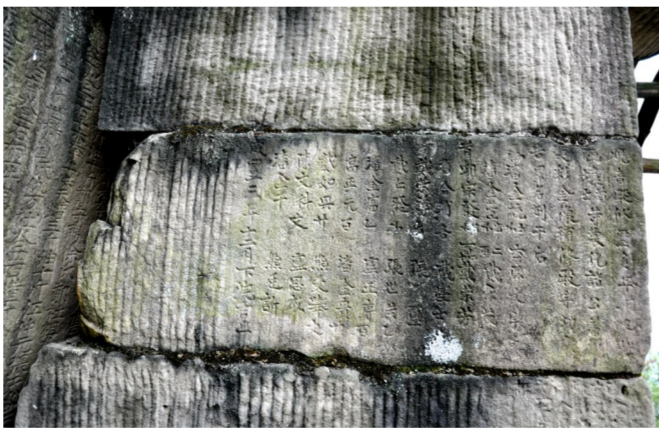
刻在崖壁上的文字