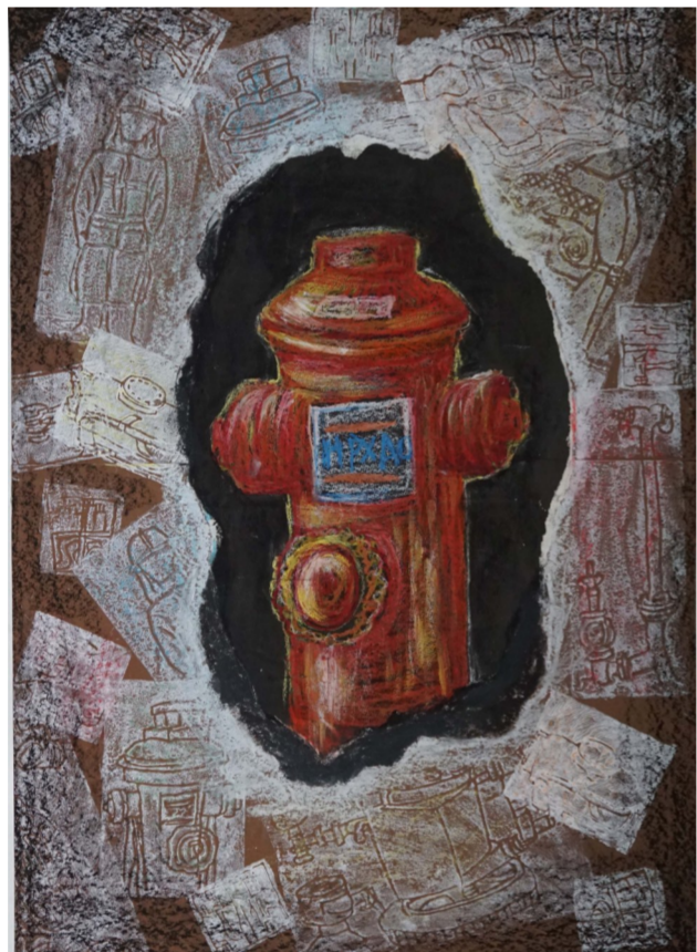
美术作品 作者 蔡俊豪