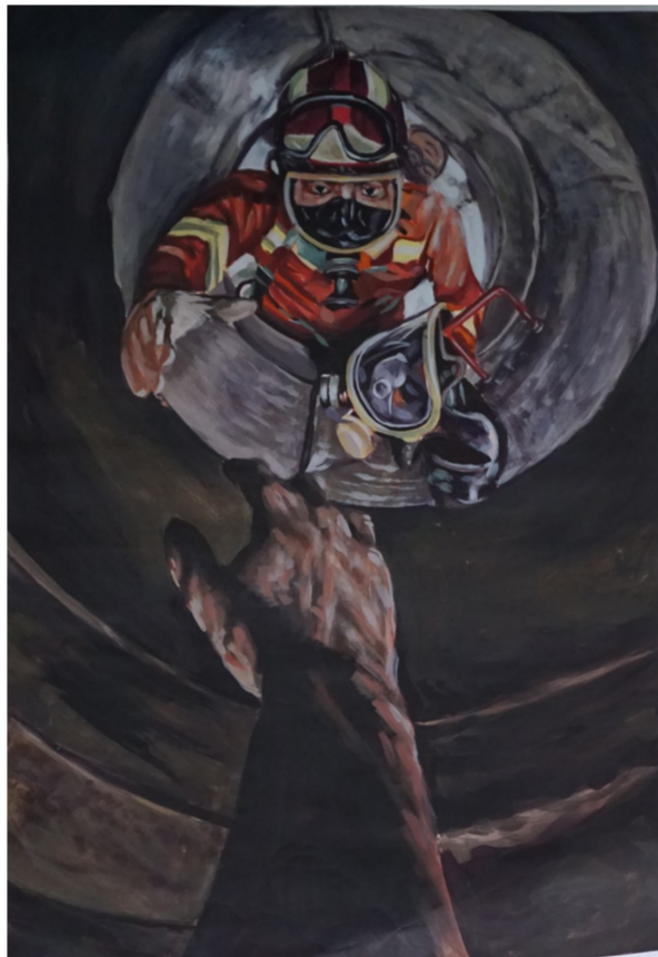
美术作品《绝处逢生》作者 贾辉平