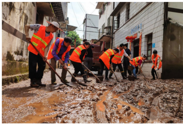
摄影组图《东溪救灾纪实》作者 吴先勇