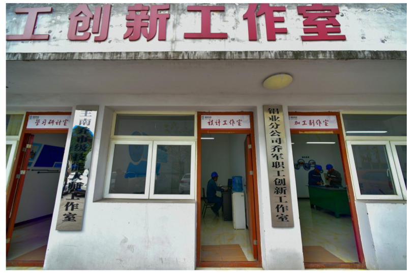
王南乔与团队在职工创新工作室里忙创新