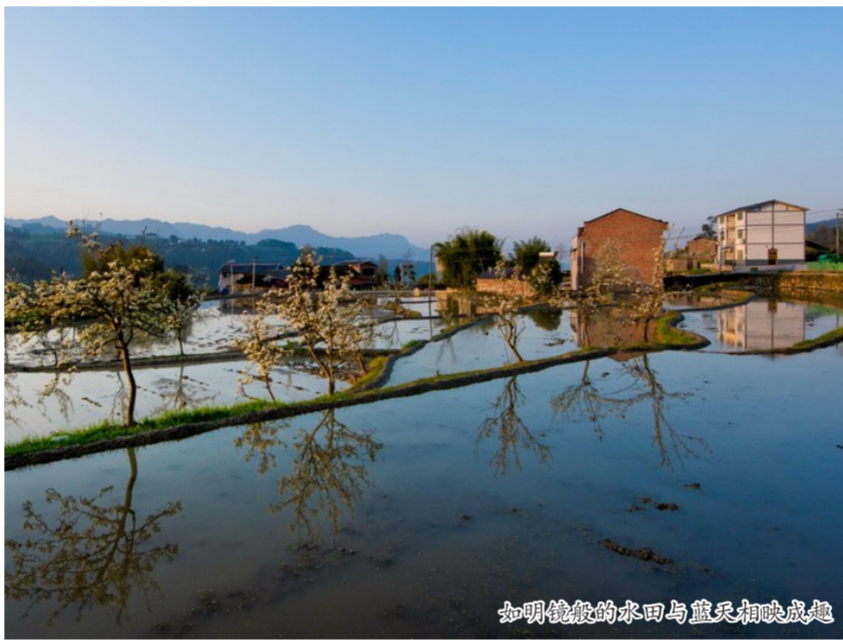
如镜般的水面与蓝天相映成趣