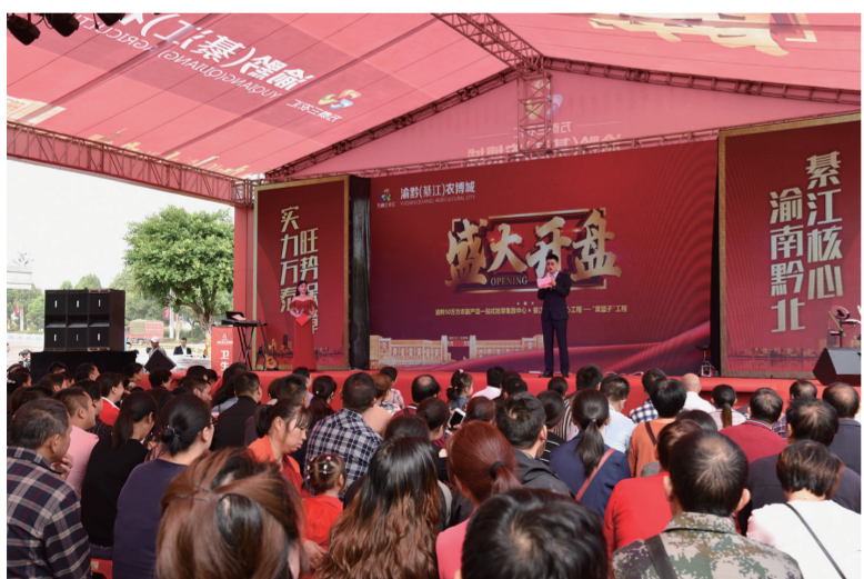
9月21日,渝黔(綦江)农博城招商营销中心热闹非凡,近千名客户亲临开盘抢铺现场。据悉,此次开盘共推出493套商铺,在两个小时内劲销85%。