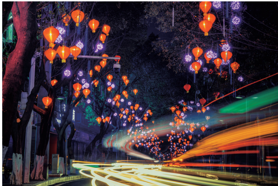
中山路星光闪烁犹如时光隧道