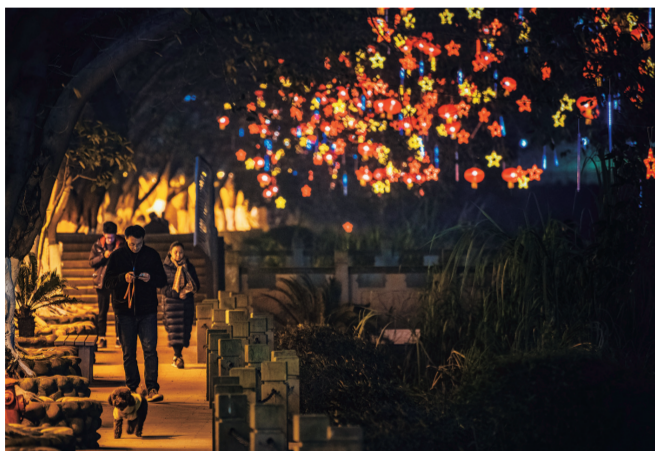
漫步在这灯的世界