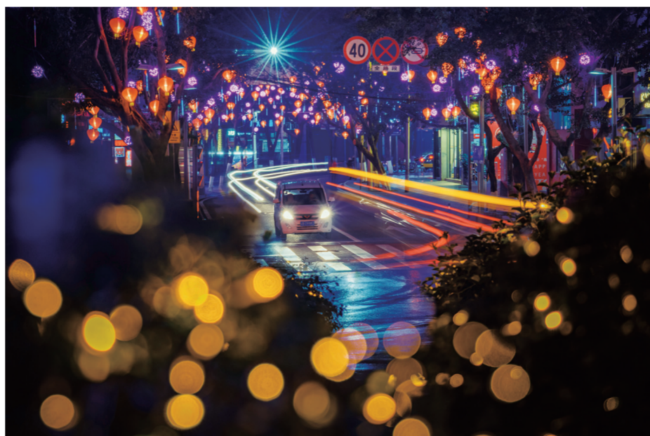
大街小巷如梦似幻