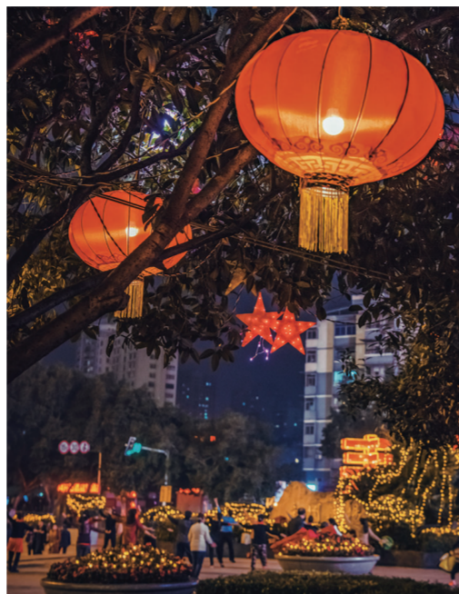
南州广场璀璨迎新