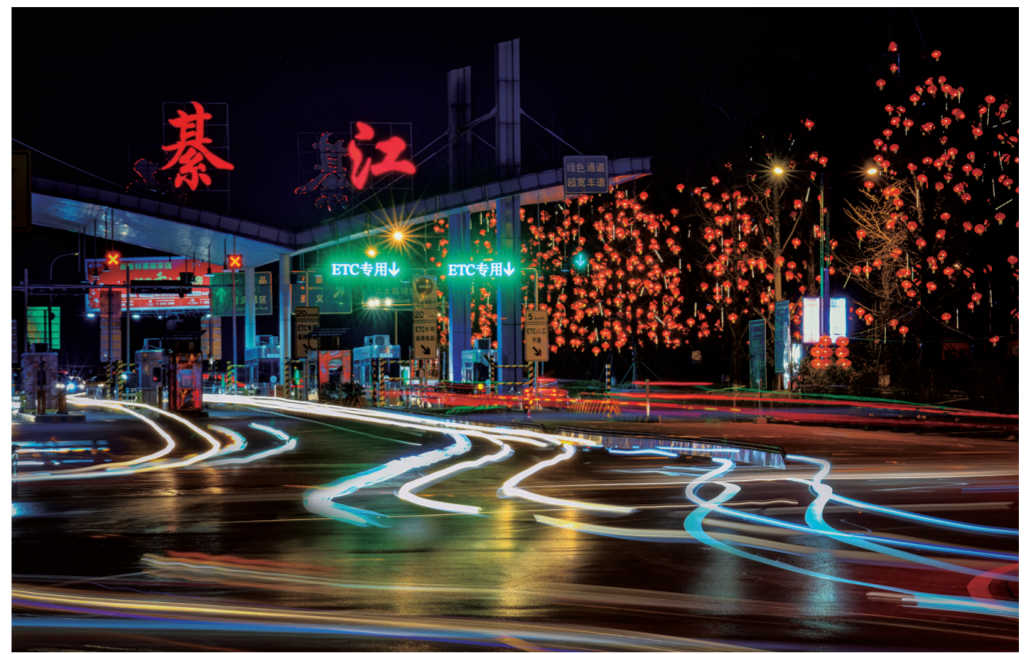
高速路口火树银花 记者 陈星宇 摄