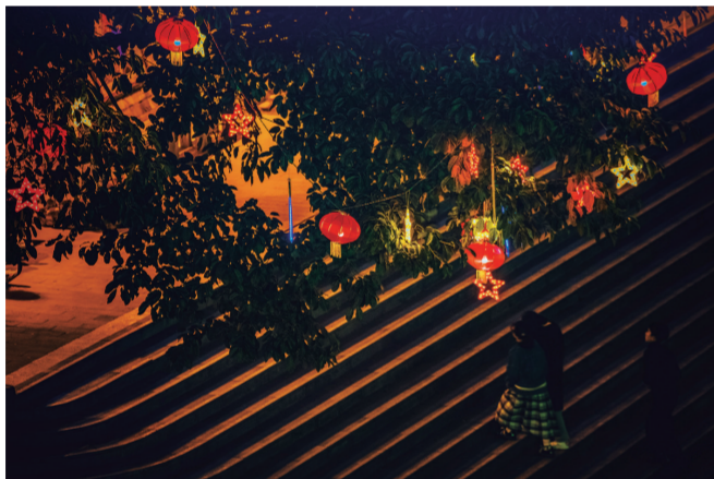
张灯结彩年味浓