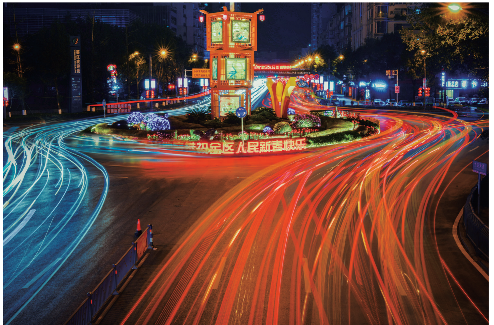
九龙大道转盘流光溢彩