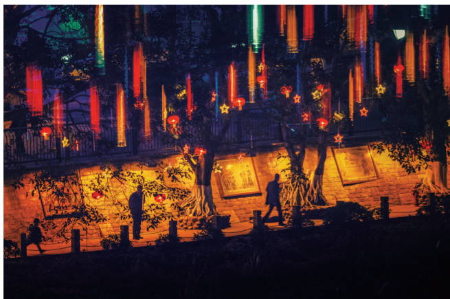
星光点点照綦河