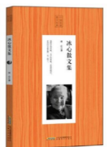
《冰心散文集》 作者:冰心 出版社:安徽文艺出版社