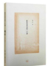
《世界美术名作二十讲》 作者:傅雷 出版社:生活·读书·新知三联书店

冰心的散文是滋养一代代青少年读者成长的精神养分,《冰心散文集》收录了《童年杂忆》等众多名篇,透过作者清新流畅的文字和女性的视角,我们会发现在母爱、童真和自然之爱以外,冰心的散文还蕴含着对亲人和祖国的爱,对人生和爱情的咏叹,甚至还包括那些超越了异质文化、地域与阶层之藩篱的大爱。《冰心散文集》教会我们心平气和地观察生活,用充满爱的眼光去打量周遭的人与事,从而让外在的现实生活与内在的精神世界洒满霞光。