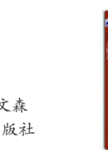
《金银岛》 作者:[英]史蒂文森 出版社:作家出版社

本书同时也是经典的儿童成长小说,作家从儿童视角出发,用夸张的想象、幽默的语言、荒诞的情节,塑造了一个生动真实的儿童形象,讲述了一个离奇有趣的成长故事,帮助许多成长中的孩子在故事中体验成长的烦恼、困惑和乐趣。故事不但充满童真童趣,而且背后还具有逻辑思辨意味,值得反复阅读。