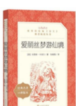
《爱丽丝梦游仙境》 作者:[英]刘易斯·卡罗尔 出版社:人民文学出版社

读这本书可以体会到傅雷先生渊博的学识,同时在20位艺术大师的作品中受到熏陶。让我们一起在傅雷先生的带领下走进美术馆,走近大师和他们的作品。