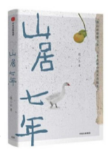
《山居七年》 作者:张二冬 出版社:中信出版社

其实,伯曼在《万物简史》中讲到的这些故事就是我们的故事,它们始终伴随着我们的生活;这些运动也是我们的运动,并以我们熟悉却不熟知的奥秘运转着。它让我们对宇宙万物和科学亲善起来,让我们的思维活跃起来。如若不信,你也可以翻开来读读,就会知道这样的推荐绝非虚言。