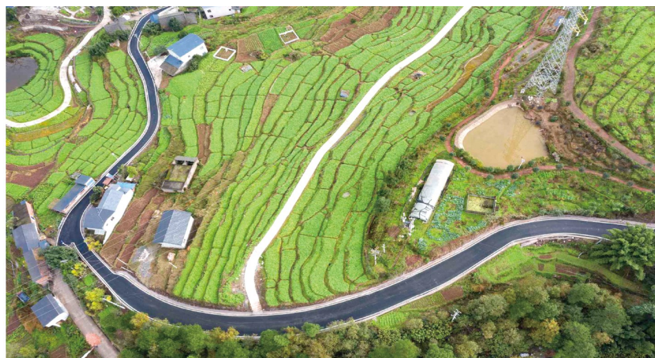
赶水草萝卜基地的产业致富路。

截至目前,中峰镇蜂群规模从2016年的不到1000群增至2020年的8000群,年均增长140%;年产量从2016年的8000斤增至2020年的6万斤,年均增长104%;年产值从2016年的200万元增至2020年的1200万元,年均增长200%;蜂农从不到100户增至500余户,培育蜂产业龙头企业1个,引进蜂产业科技公司1个,成立中峰镇养殖专业合作社4个,建起养蜂家庭农场13个,标准化养蜂园33个,成为了乡村振兴的一个典型范例。