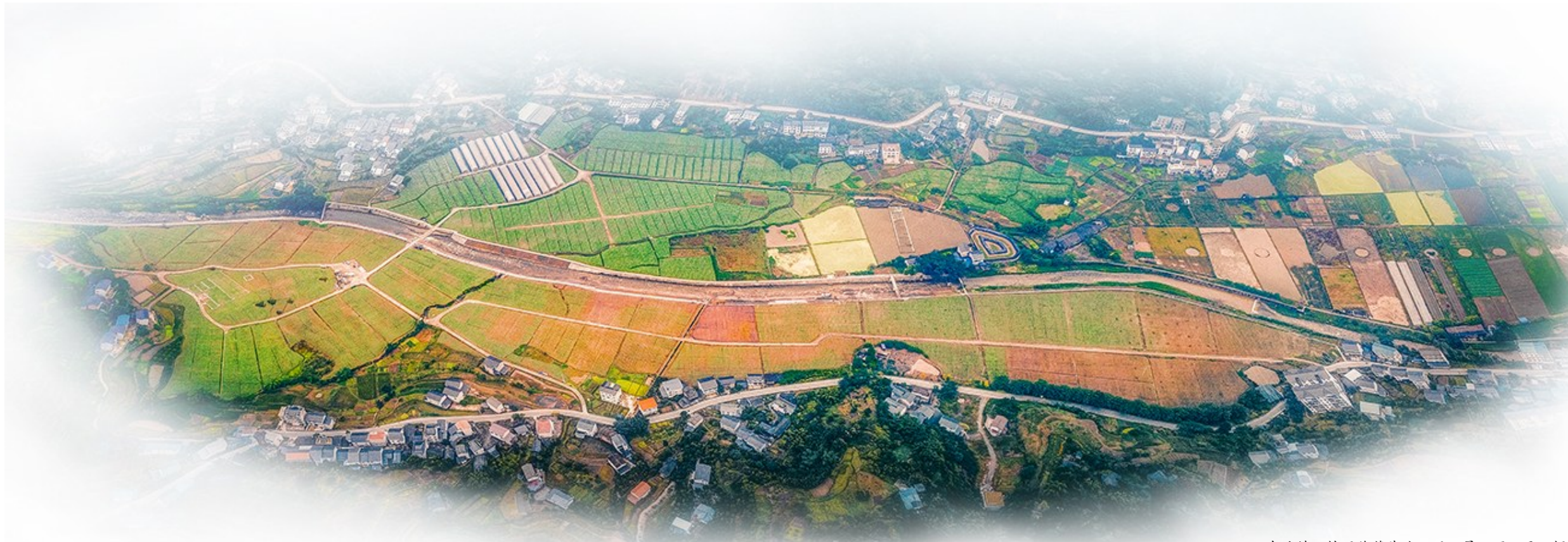
东溪镇双桂园蔬菜基地。