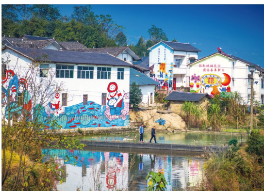
古南街街道坝村人居环境换新颜。