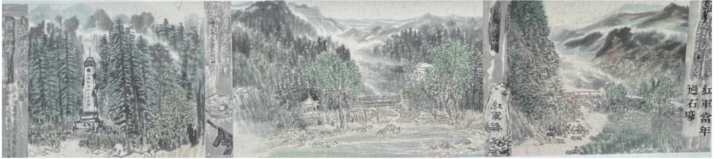
张涌《穿越九盘子关隘》

綦江是中央主力红军在重庆的唯一过境地,为中央红军实现伟大转折提供了重要保障和支持,是三大主力红军在重庆活动的重要节点。在这片红色土地上,涌现了许多可歌可泣的英雄事迹。而伟大的革命精神更是激励着我们砥砺前行。