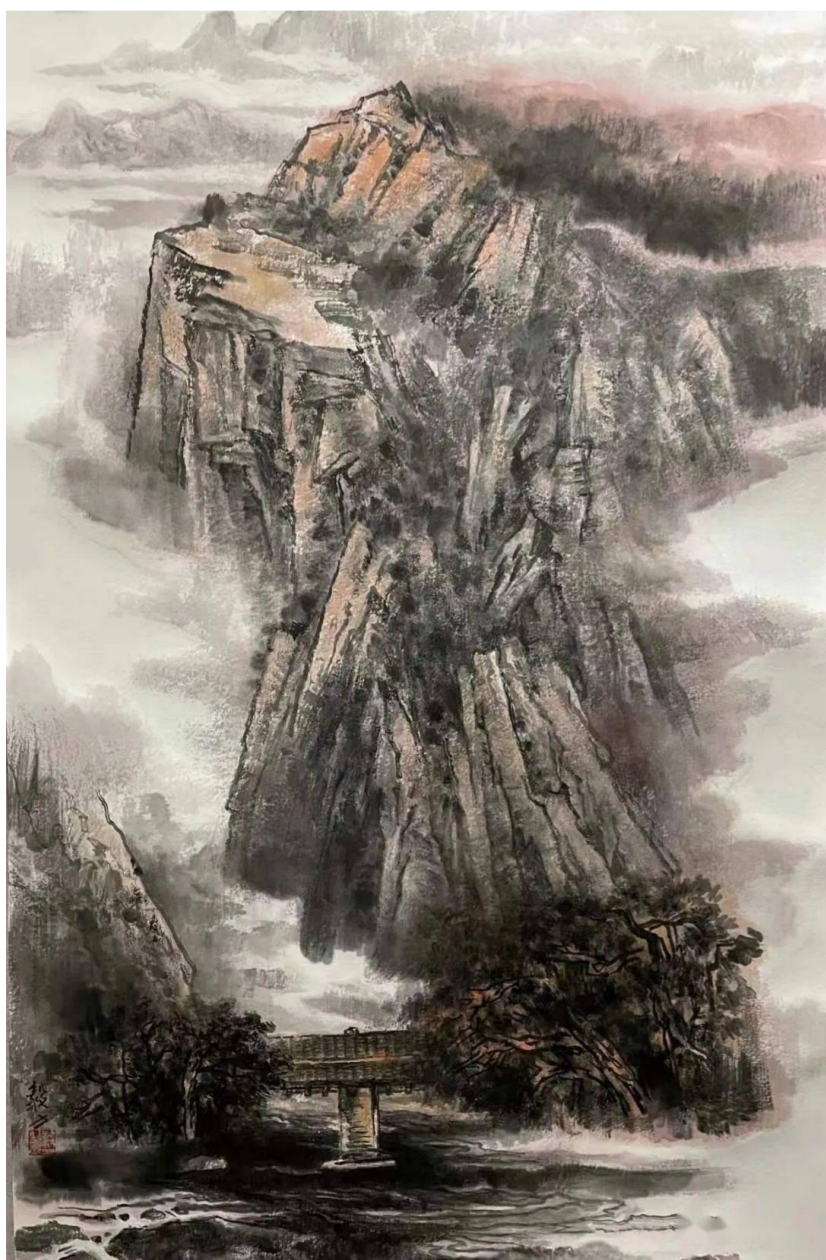
李毅力《紫气秋来红军桥》