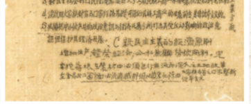
当时刊物上登载关于土地改革的内容。