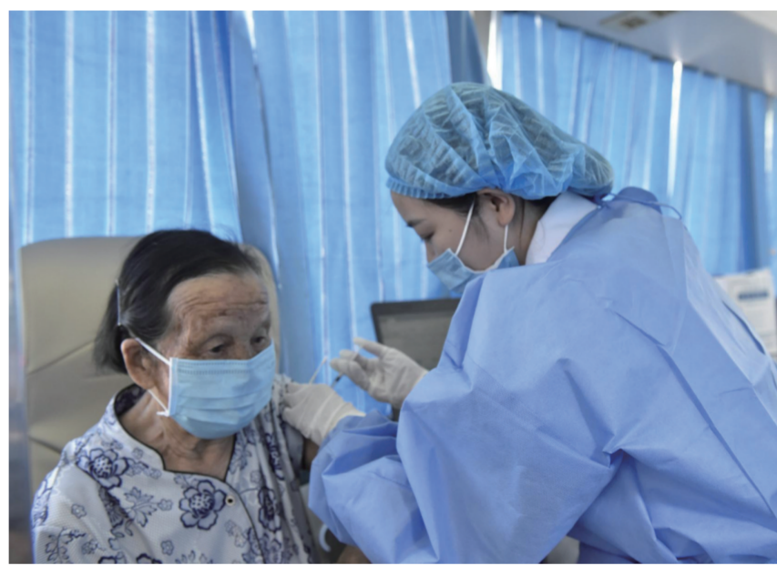
市民在古剑山景区纳凉点接种新冠疫苗。

本报讯(记者 廖静)“没想到景区能接种疫苗,太方便了!”7月27日,年近90岁的周婆婆在家人搀扶下,来到綦江古剑山景区纳凉点接种新冠疫苗。