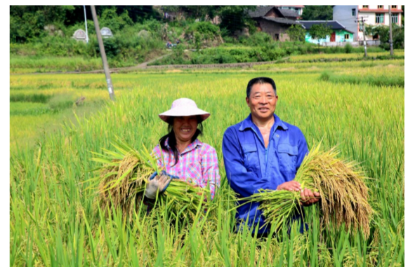
在插旗村,丰收的喜悦洋溢在每一位村民的脸上。