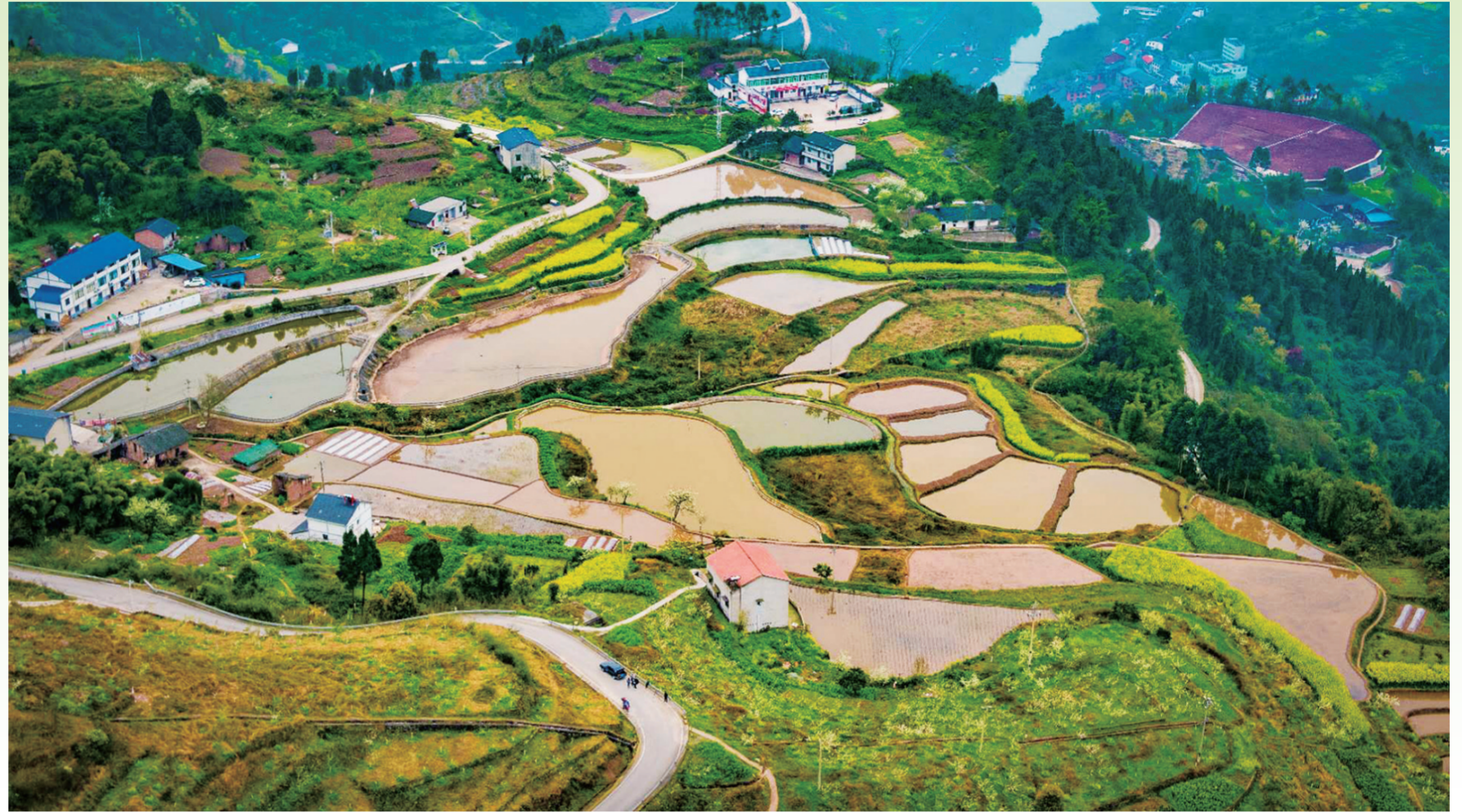
插旗村景色宜人(资料图片)。

扶欢镇插旗村曾是我区25个贫困村之一,户籍人口1200余人,而常住人口不到300人。早些年,大家对插旗村的印象,也都停留在“山高路陡人少”。然而,近几年插旗村通过挖掘自身优势,因地制宜发展大米种植,并打造特色产业,成功走出了一条致富的康庄大道。如今的插旗村产业兴、道路通、谷满仓、果飘香。人们再提起插旗村,想到的则是“远看果,近看粮,处处皆是好风光”。