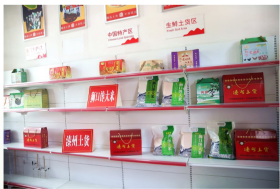
农产品走上品牌化道路。