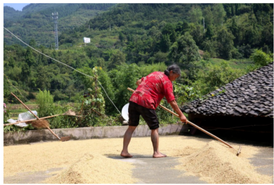
村民在晒稻谷。