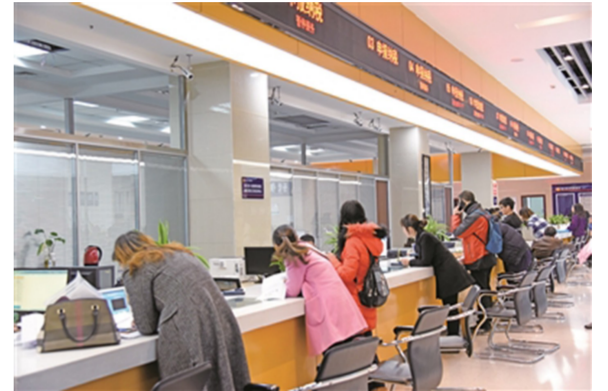
市民在市民服务中心办理业务。

从深化“证照分离”落实住所申报承诺制办理营业执照,到企业投资项目模拟审批,实现拿地即可开工,一个个“绿色通道”的开通,让綦江营商环境进一步优化。