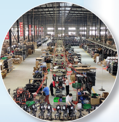
炎焱摩托生产车间。

重庆炎焱动力制造有限公司是我区一家集摩托车研发、生产、销售和售后服务为一体的出口型企业。10月,该公司借助阿里巴巴国际站平台正式进军跨境电商,当月公司全部车型就实现线上接单。11月,一笔货值90210美元的汽摩整车货物,就通过该跨境电商平台直接出口至玻利维亚,实现了綦江跨境电商销售零的突破。 “通过跨境电商的平台出口,缩短了对外贸易的中间环节,使我们与客户的沟通更加便捷高效,有利于把产品推向世界各地。”重庆炎焱动力制造有限公司销售经理王浩说。 区商务委外经贸科科长翁春介绍,这两年,为减少疫情带来的负面影响,我区坚持把跨境电商作为促外贸稳增长的重要抓手,扎实推进跨境电商的发展