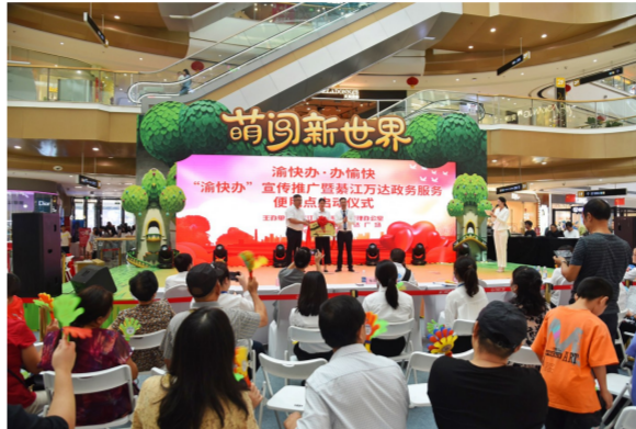
政务服务进商圈。