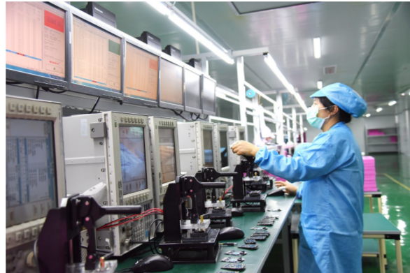
南舟科技生产车间正在生产芯片。