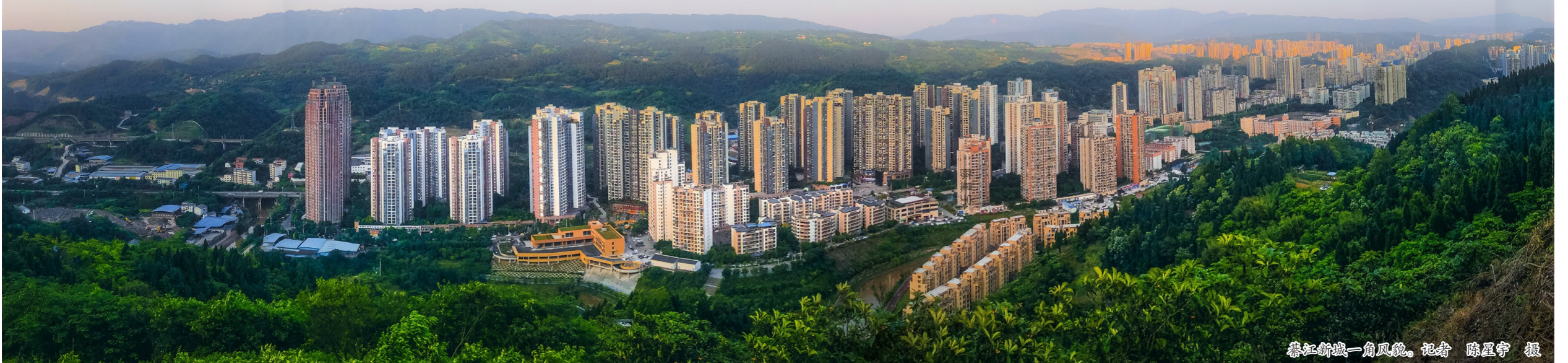
綦江新城一角风貌。

投资领域,实行外商投资准入前国民待遇加负面清单管理制度,完善投资者权益有效保障机制。瞄准世界科技革命、产业革命新趋势,推进与“一带一路”、长江经济带、成渝地区双城经济圈等沿线城市、企业的经贸合作,承接国内外产业转移。组织辖区企业积极参加智博会、进博会、西洽会等活动,搭建多元交往平台,推进专业化、精准化、集群化招商,促进资源整合、产业互动、合作共赢。健全贸易便利化体制机制,提升通关服务水平,推行国际贸易“单一窗口”,推动与东盟国际货物“一站式”运输。 文/记者 王瑜