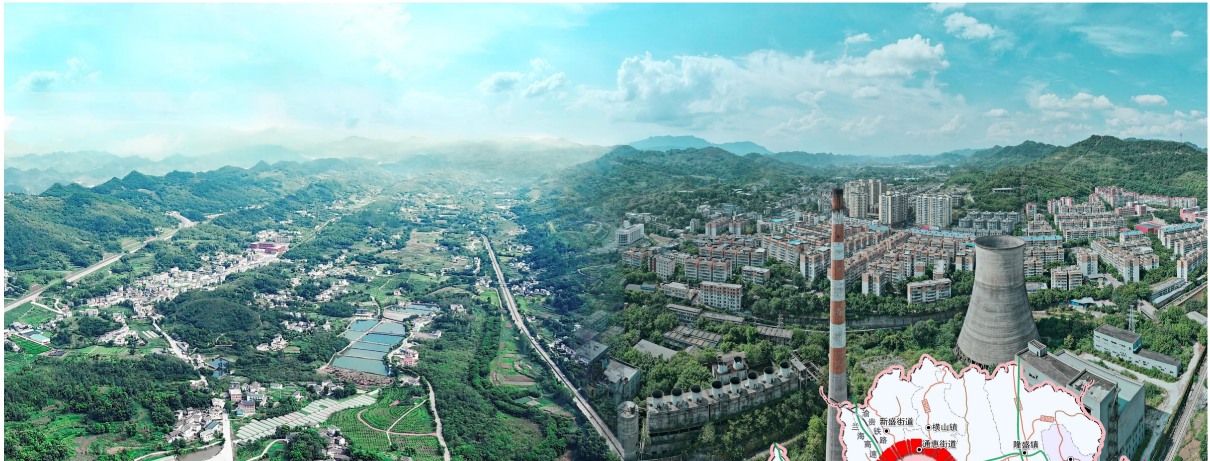
永城和南桐现貌