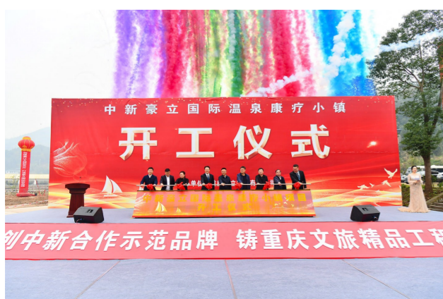
中新豪立国际温泉项目开工仪式举行。