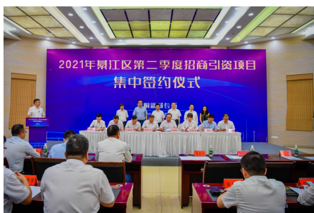
招商引资永桐新城专场集中签约仪式。