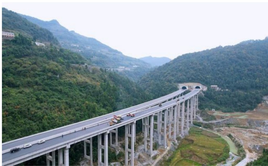
渝黔复线高速带动发展。