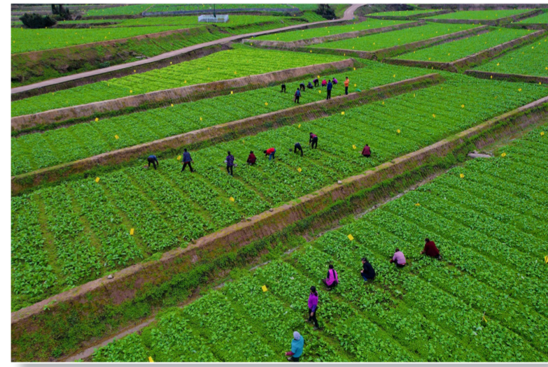
希望的田野。