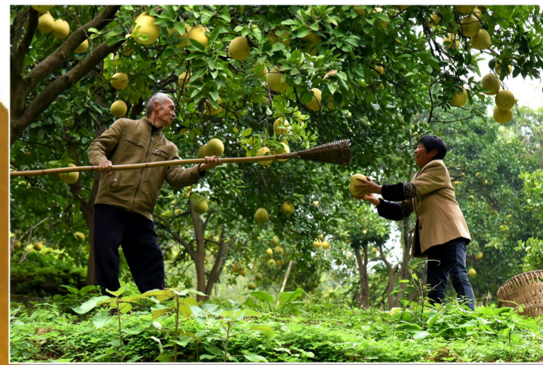
果农收获成熟的柚子。