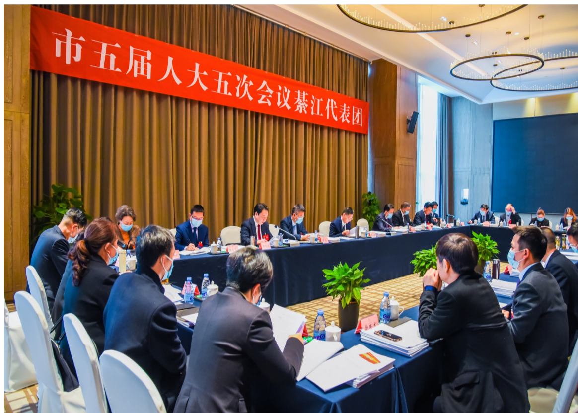
1月18日，綦江代表团举行全体会议，继续审议市政府工作报告，审查计划报告和草案、预算报告和草案。