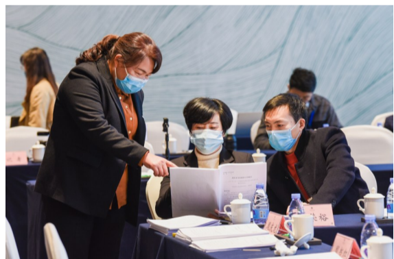
会议间隙，几名代表就政府工作报告相关内容交流讨论。