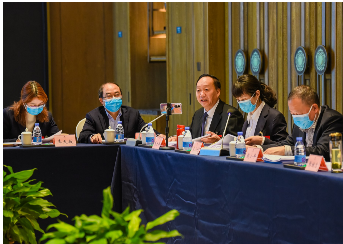
在綦江代表团会场，代表积极建言献策。