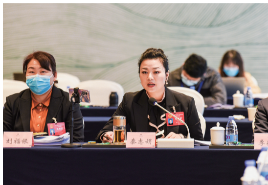
在綦江代表团会场，代表正在踊跃发言。