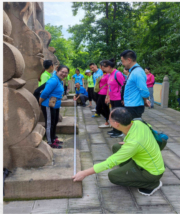
▲文史爱好者现场测量。