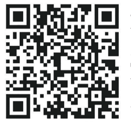
綦江区人才工作“金点子”征集表

人才工作金点子投稿+姓名”。此次活动将根据投稿情况评定一定数量的特等奖和一、二、三等奖,并以作品为单位分别给予3000元、1000元、800元、500元的现金奖励。