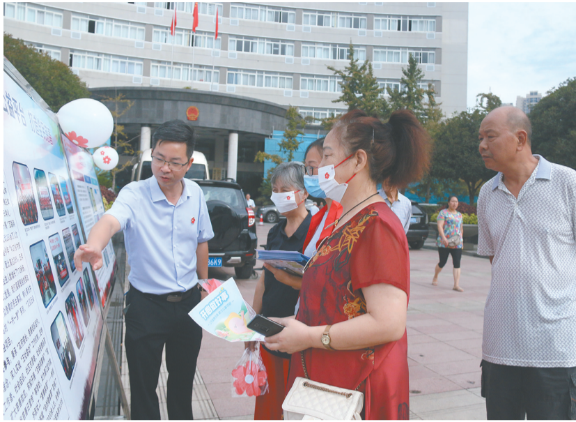
志愿者指导群众参与互联网公益。

本报讯(通讯员 陈焱)日前,记者从相关部门获悉,我区围绕“携手做慈善,传播真善美”,在重庆慈善周期间推出“一村一梦”系列、“守望幸福·情满南洲”、“文明城区你我共创”等涉及助力乡村振兴、创建文明城区等方面的公益项目,多渠道开展互联网公益活动,累计获得各街镇、部门以及社会各界爱心人士等超20万人次爱心接力,筹集资金5800余万元。