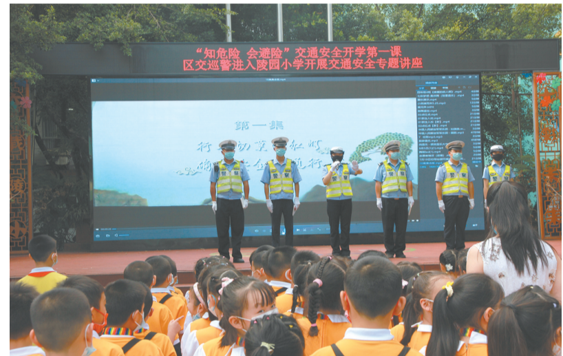
交巡警用皮影戏影集讲解交通安全知识。

本报讯(特约通讯员 左定贤)为进一步提高学生安全意识和自我保护能力,连日来,区公安局组织开展形式多样的学校安全教育活动,筑牢生命安全防线,推进平安和谐校园建设。