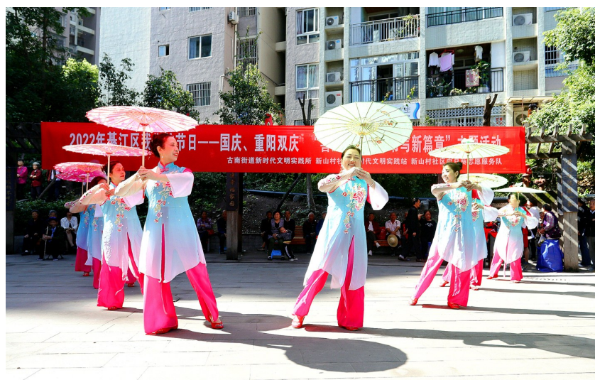
新山村社区宣传队在表演舞蹈《四德歌》。