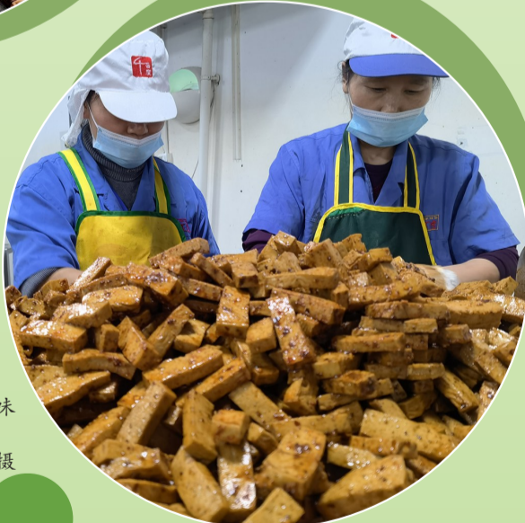
▶位于食品园区的重庆多味多食品有限公司生产车间。