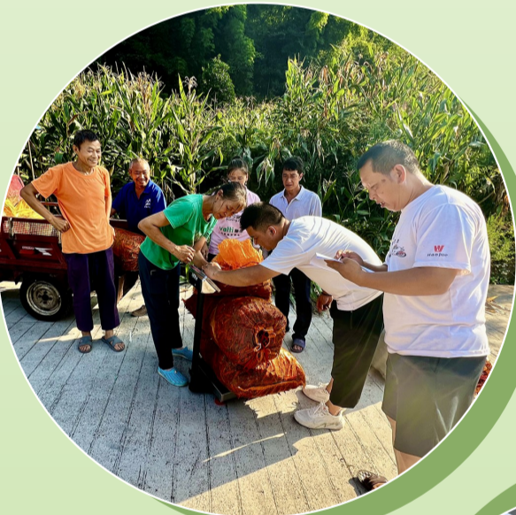
▲收购辣椒现场。(资料图片)

不论是脱贫攻坚还是乡村振兴,产业兴旺一直都是基础、是重点。经过近几年的发展壮大,我区农业经济发展从单一零散式向标准化、集约化、规模化方向发展,形成大产业、大基地、大品牌的产业体系。如今的綦江大地,农业产业生机勃勃、人居环境优美宜居、乡风乡情淳朴朴实、广大农民安居乐业,正在阔步走向“村美民富产业兴,‘农’墨重彩新画卷”的康庄大道上。