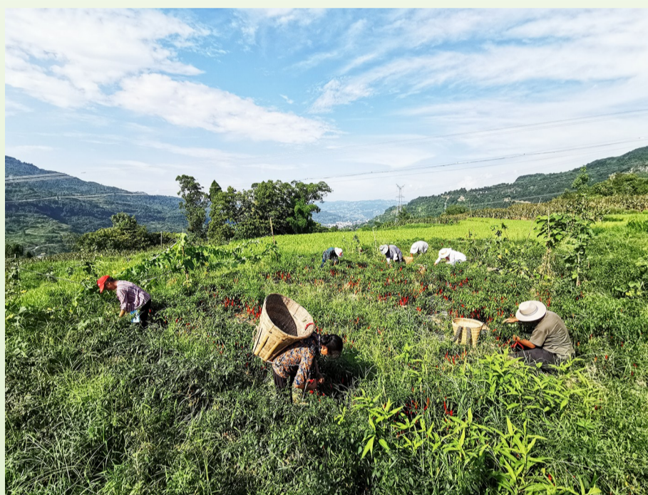
东溪镇,村民们采收辣椒。(资料图片)通讯员 程娟 摄

区畜牧站站长叶昭辉说,2022年全区统筹资金约1000万元,用于支持种羊引进、种羊场建设和扩大养殖场规模