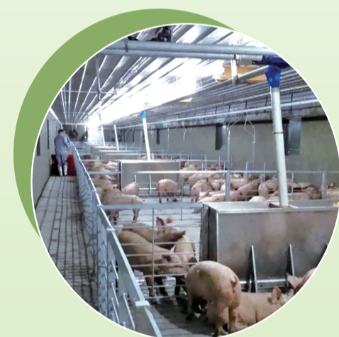
▲位于三角镇的正大集团种猪场首批种猪入栏。(资料图片)