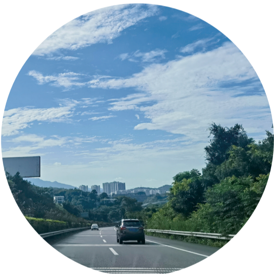
綦城上空白云飘。通讯员 赵娟 摄