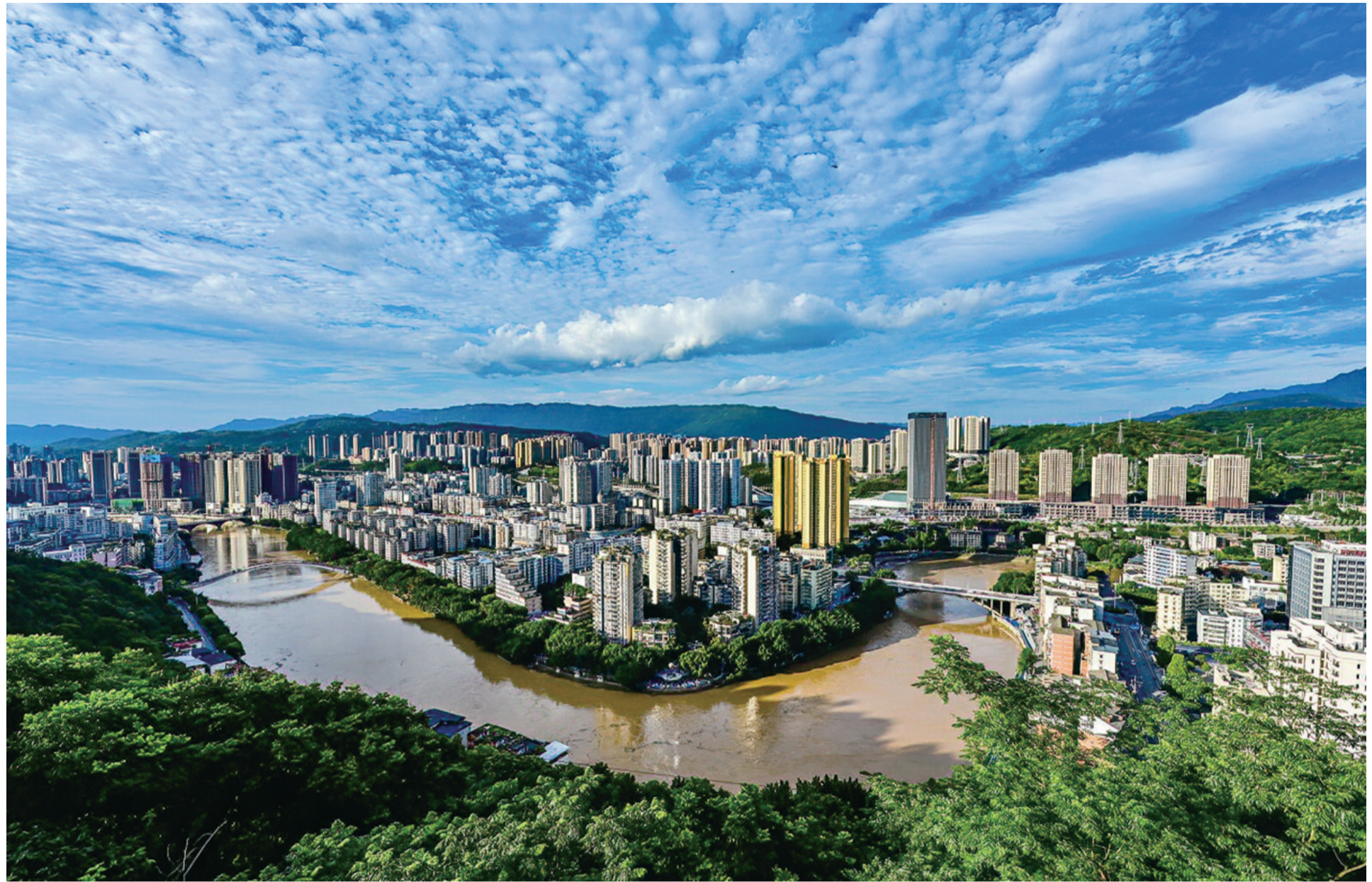
7月4日,綦江雨后放晴碧空如洗。特约通讯员 陈宗武 摄