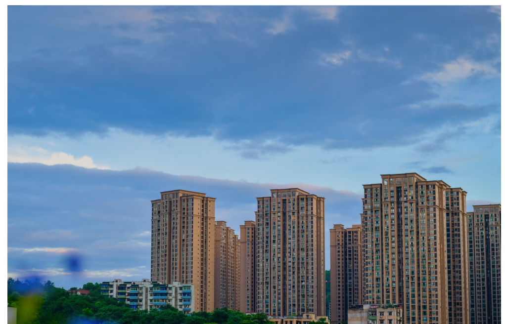
7月4日,落日余晖中的城市宁静祥和。