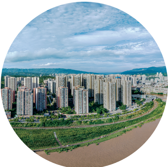
綦江河段洪水水位逐渐回落。