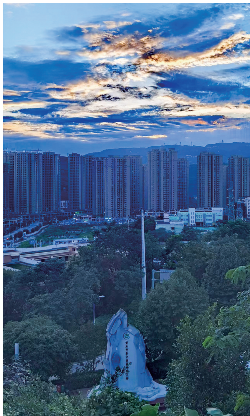
綦城一角。