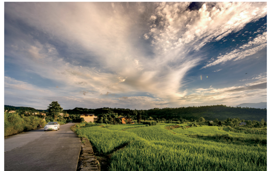
7月4日傍晚,郭扶镇田野霞光万里长。