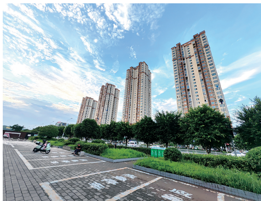
7月4日,雨过天晴,“綦江蓝”刷屏。