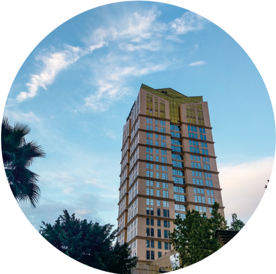
蓝天白云下的普惠豪生酒店。