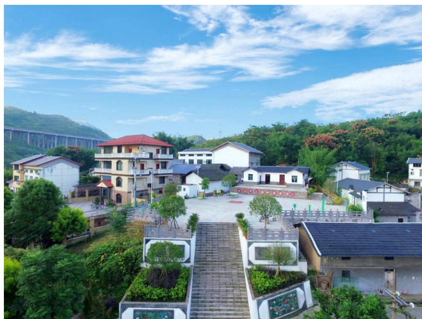
珠滩村人居环境示范点。

本报讯(记者 谢天骄 特约通讯员 刘雪秋)在去年的老旧小区改造中,古南街道遇仙桥社区下足“绣花”功夫,扮靓“面子”的同时努力提升“里子”,让居民群众成为社区治理的参与者,共享治理成果。 古南街道有不少修建于上世纪七八十年代的老旧居民楼。在第二批主题教育中,该社区干部通过走访收集到大同路小区东苑居民集中反映的热点问题,希望对小区的环境进行升级改造。 据了解,大同路小区东苑位于古南街道北街1号,小区共有6个单元107户,常住居民321人。街道和社区经过实地调研后,发现符合相关改造条件,决定对其进行升级改造。 改造过程中,不仅重新划设了消防通道,还添置更新了消防设施、垃圾分类