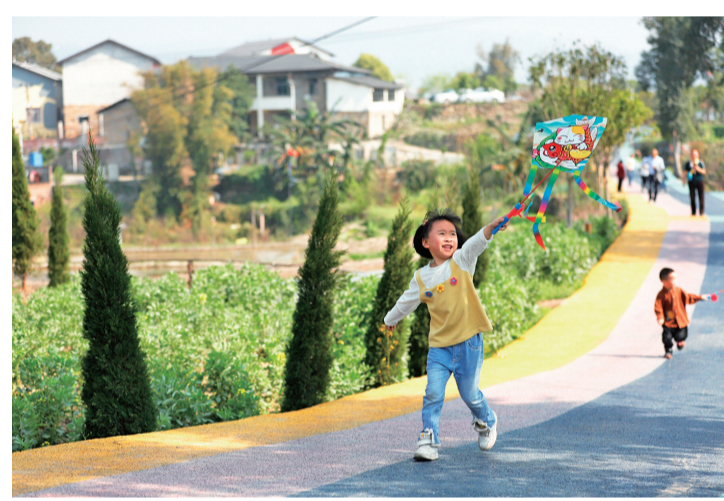
孩子们开心自在地放飞风筝。