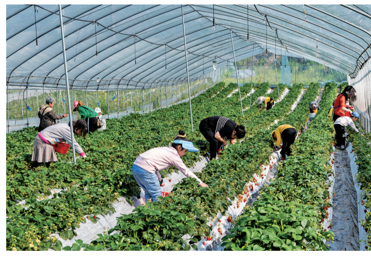
香甜诱人的草莓吸引游客前来采摘。