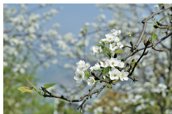
梨花争相开放。