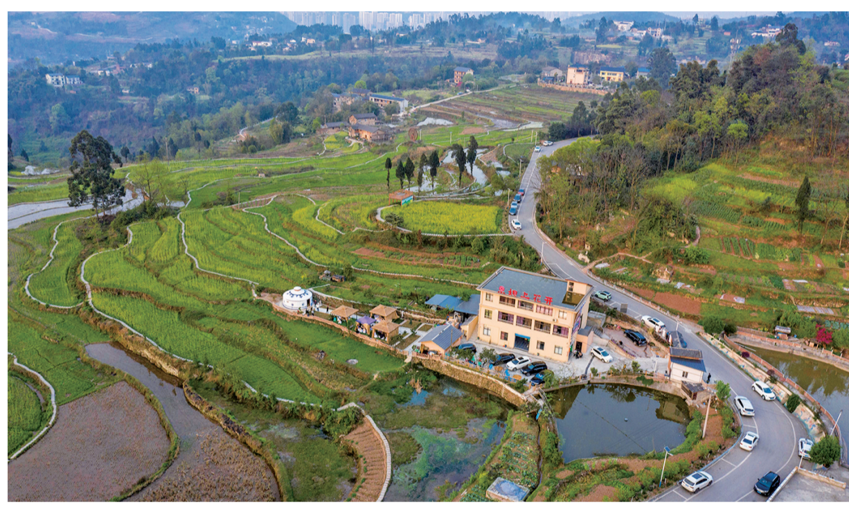
民居坝上花开。