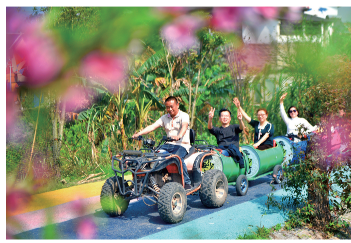
满载游客的“小火车”从桃花林中穿过。