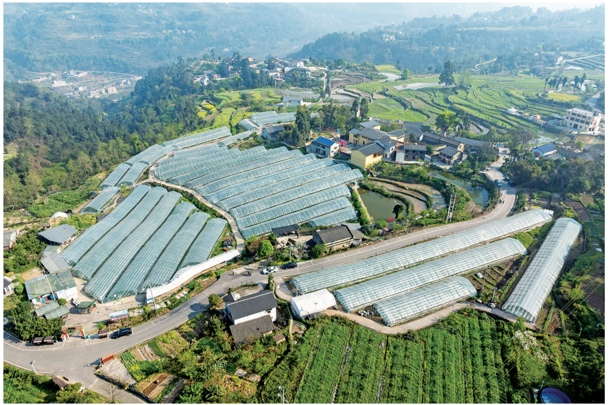
俯瞰花坝村草莓基地。特约通讯员 陈再华 摄

“布谷声中日又斜,石桥流水两三家。乡村春色无人管,开尽棠梨几树花。”近日,春光正好,区融媒体中心组织通讯员采风活动走进古南街道花坝村,我们欣然同往。