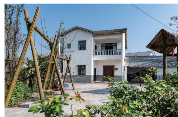
青瓦白墙,屋舍俨然。