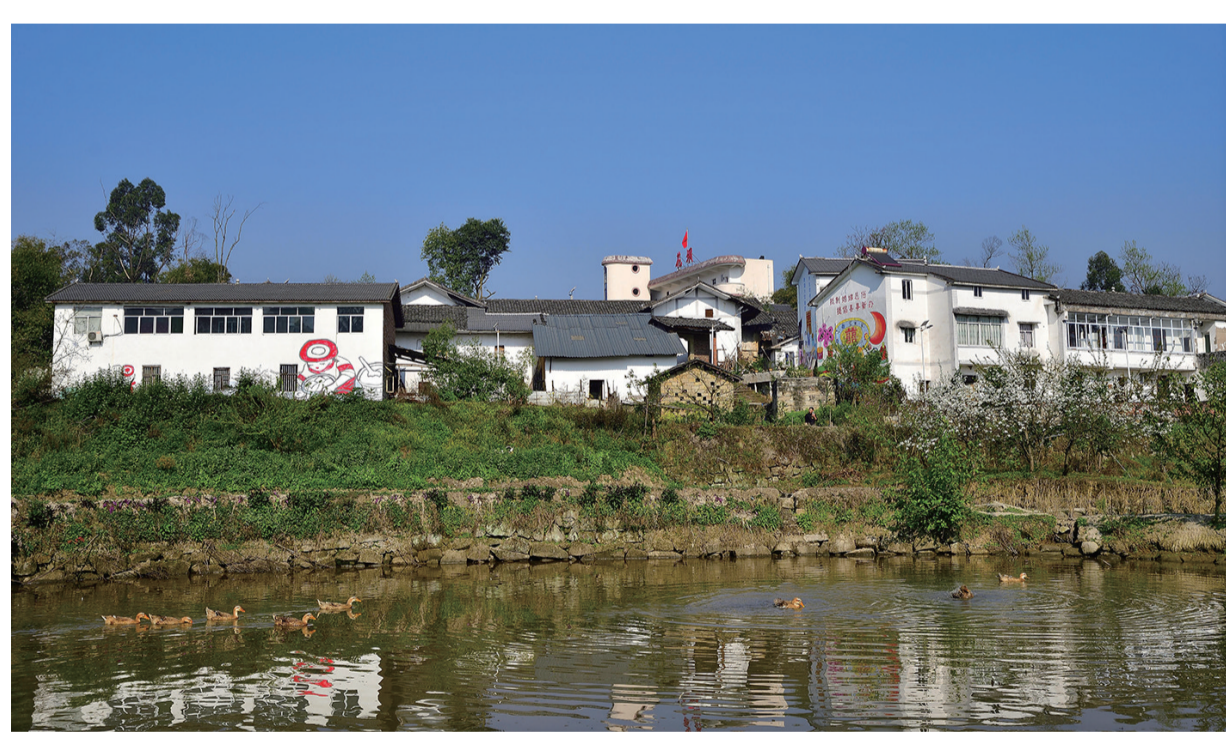
村庄静怡,鸭群三两。