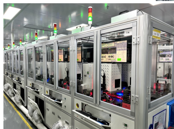
在重庆新视通智能科技有限公司二期数字化、千级无尘净化生产车间，数十台六头平面式高速固晶机高速运转。