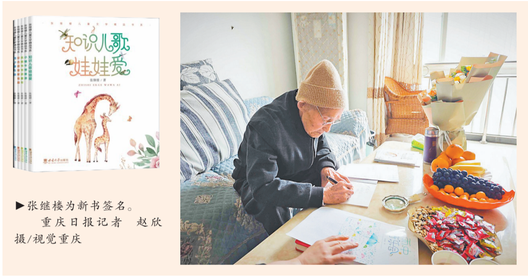
▶张继楼为新书签名。

张继楼是我国成就卓著的儿童文学作家之一。20世纪50年代起，他就在儿童文学的花园里酿蜜。日前，西南大学出版社全新推出了“张继楼儿童文学精品书系”。近日，新重庆-重庆日报记者随出版社工作人员专程为老先生送去新书。98岁的张继楼乐得像个孩子，他说自己有个心愿：我要带着爱，继续耕耘在儿童文学的花园。