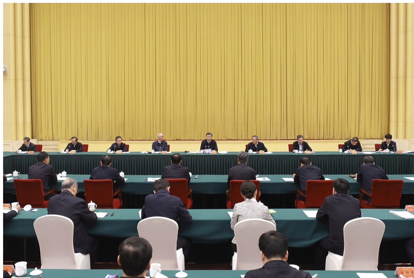
4月23日下午，中共中央总书记、国家主席、中央军委主席习近平在重庆主持召开新时代推动西部大开发座谈会并发表重要讲话。