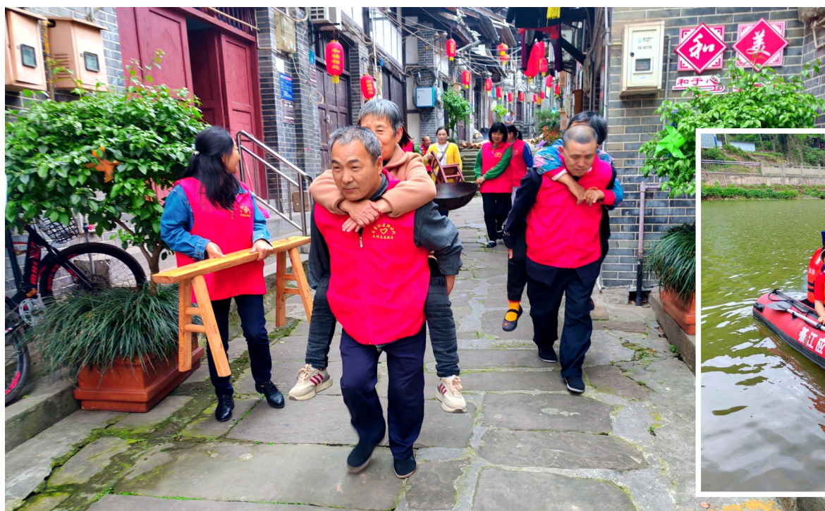
社区应急人员有序撤离行动不便老人。应急队员有序撤离被困人员。

日前,石角镇举行防汛演练,模拟该镇突发洪水,辖区内出现山洪暴发、场镇被淹、人员被困等多种险情。按照防汛抢险应急预案,区镇两级防汛抗旱指挥部与石角镇石角社区紧密联动,迅速组织现场抢险组、人员转移组、医疗救护组、后勤保障组等应急处置,安全转移石角镇沿河居民。演练有条不紊,应对迅速,进一步提升了群众防汛意识和镇村干部应急处置能力。