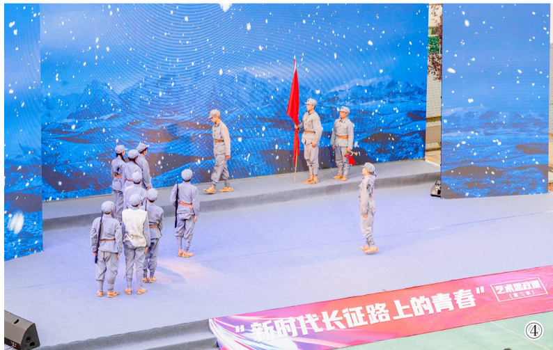
图①：原创歌曲《再唱东方红》。 图②：原创情景歌曲《小平您好》。 图③：朗诵《从这里出发》。 图④：情景剧《老兵》。