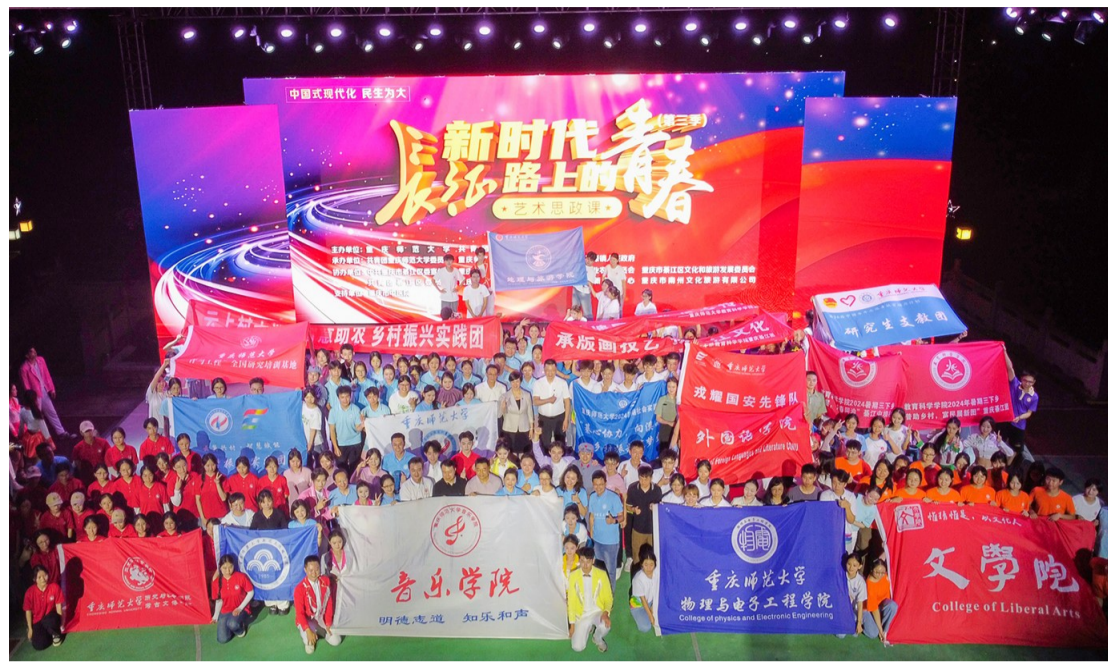
思政课堂现场合影。