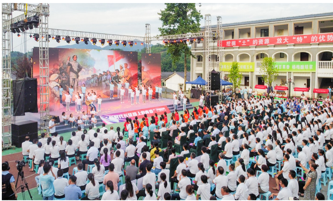
一个个红色原创作品涤荡人心。