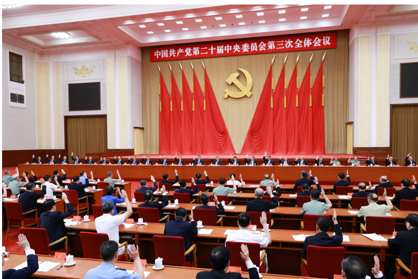
中国共产党第二十届中央委员会第三次全体会议，于2024年7月15日至18日在北京举行。中央政治局主持会议。