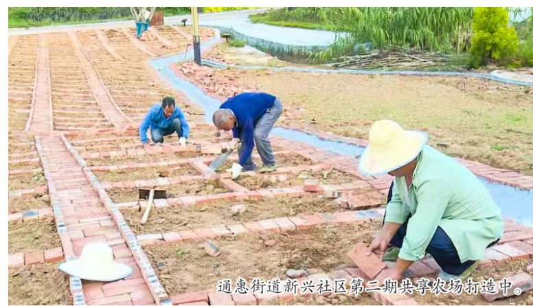
通惠街道新兴社区第二期共享农场打造中。