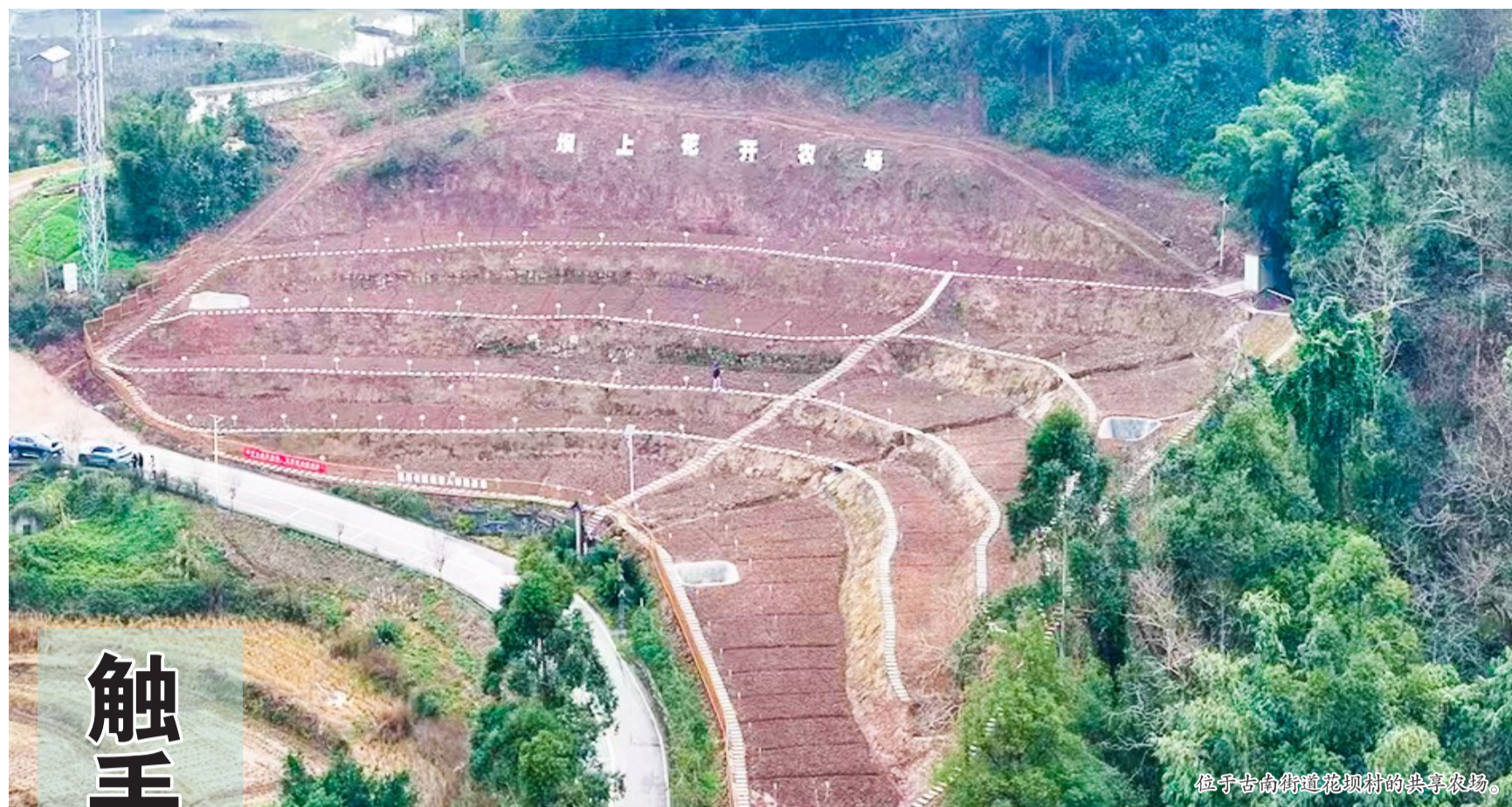
位于古南街道花坝村的共享农场。