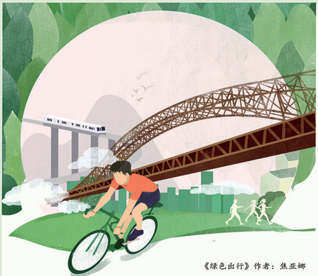
《绿色出行》作者: 焦亚娜