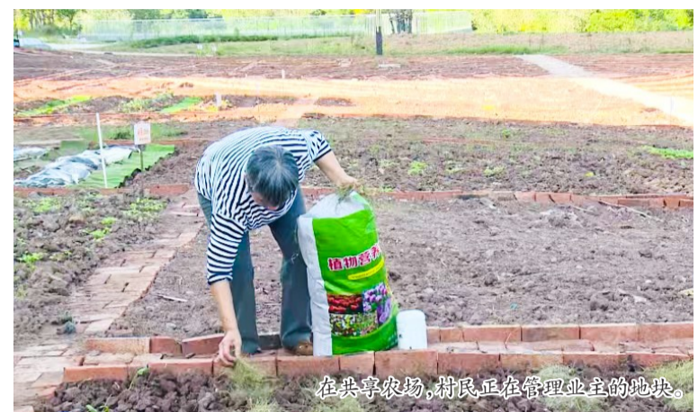
在共享农场,村民正在管理业主的地块。