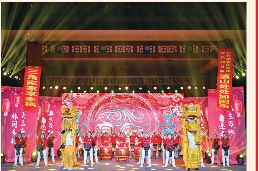
群众载歌载舞,共迎佳节。

“让群众当主角、站C位,活动才能吸引更多人参加。”三角镇相关负责人表示,“我镇已举办了十四届乡村春晚。未来,将持续打造更多高质量文化活动,以文化为笔,绘就和美丽乡村新画卷。”