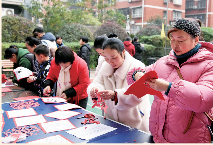
社区居民体验剪纸。